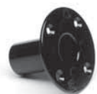
Stativflansch (Option) für die Verwendung mit Boxen-stativen; Ø 36mm