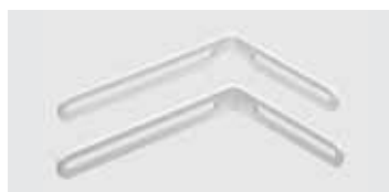
Montagewinkel lang (Option) Ermöglicht stärkeres Neigen der Tonsäule; Maße: 18,5 x 13,5 cm