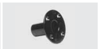
Stativflansch (Option) für die Verwendung mit Boxen- stativen; Ø 36mm