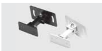
Schwenk/Neige-Halterung (Option) schwarz oder weiss