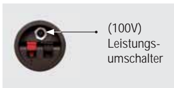
Anschlussklemme (Standard 100V)