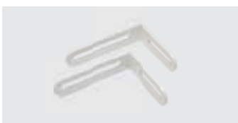
Montagewinkel kurz (Standard) Maße: 9 x 6,5 cm