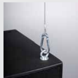
19 Flugpunkte M10 integriert incl. 4 Ringösen M10.