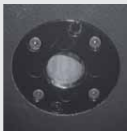
Stativ-Flansch an der Unterseite und Oberseite der PowerTop