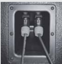
SPEAKON-Anschlüsse an der Rückseite des PowerTop