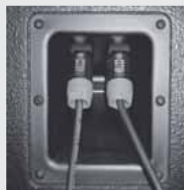
SPEAKON-Anschlüsse an der Rückseite des PowerTop